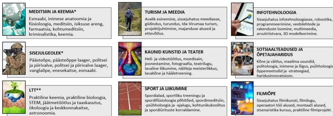
Joonis 4: JG valikmoodulid

*Moodulid „Meditsiin ja keemia“ ning „Sisejulgeolek“ valitakse kolmeks õppeaastaks