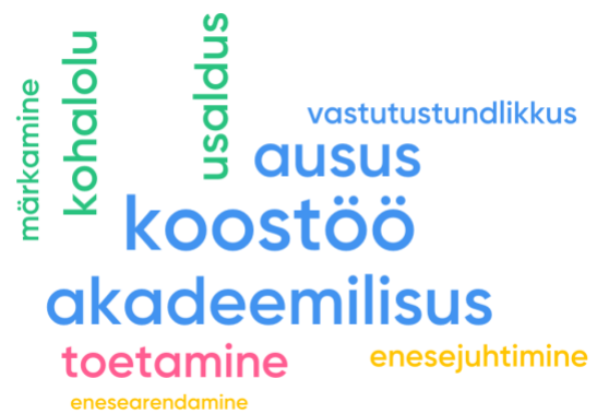
Joonis 1: JG väärtused

JG toetab noort olema inimlik, loov ja tark maailmakodanik. Lisaks traditsioonilisele tarkuse taganõudmisele luuakse keskkond loovuse arenguks ja inimeseks kasvamiseks. Inimeseks, kes panustab Eesti ja kogu maailma sotsiaalsesse, kultuurilisse, majanduslikku ja keskkonnakaitselisse arengusse oma võimete realiseerimise abil.