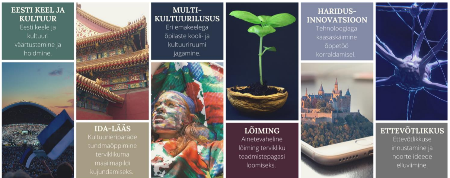
Joonis 2: JG fookus